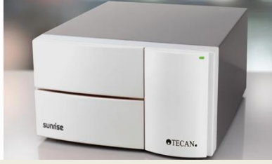
Tecan Sunrise microplate Reader