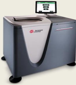
Optima XE-100 Ultracentrifuge