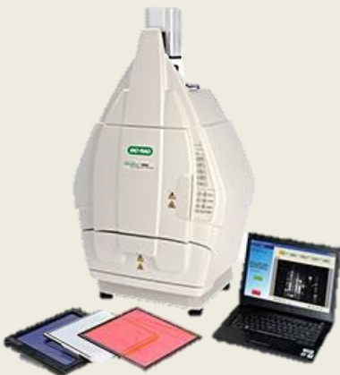
Chemi doc MP Imaging System