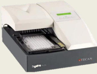
HydroFlex Plus microplate washer