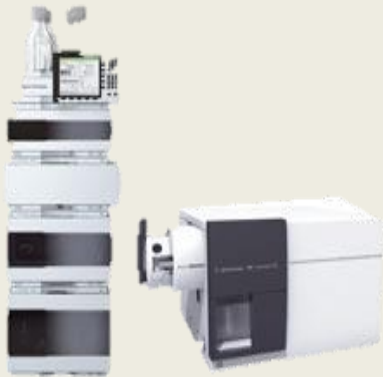
HPLC Infinity 1290 + Evaporating Light Scattering Detector (ELSD)