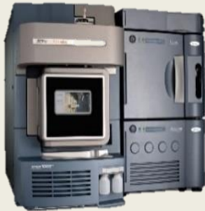
UPLC- LC/MS Triple Quadrupole